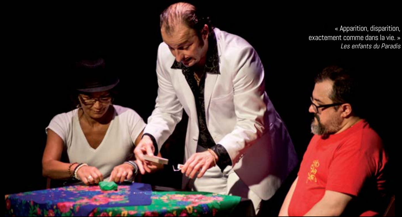
« Apparition, disparition, exactement comme dans la vie. » Les enfants du Paradis

Le spectacle interroge la longue histoire des bonimenteurs, des femmes oiseaux et des illusions roturières : celle des rues, des places et des espaces largement ouverts au public.