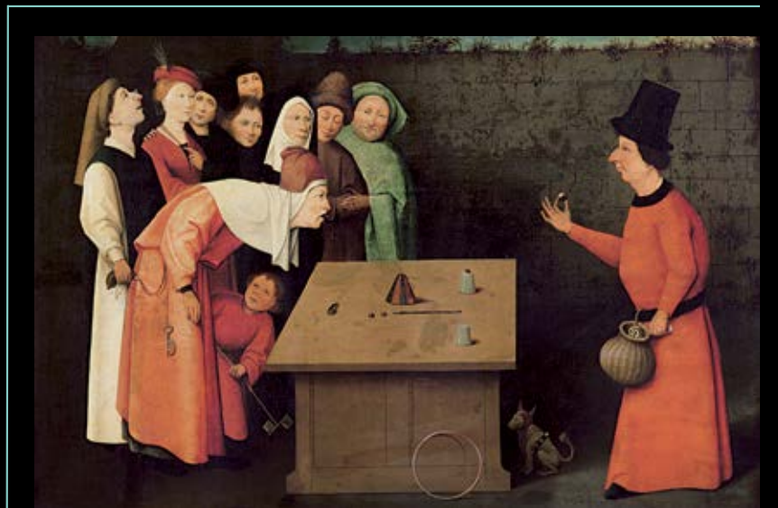
Jérôme Bosch L'Escamoteur

Le spectacle interroge la longue histoire des bonimenteurs, des femmes oiseaux et des illusions roturières : celle des rues, des places et des espaces largement ouverts au public.