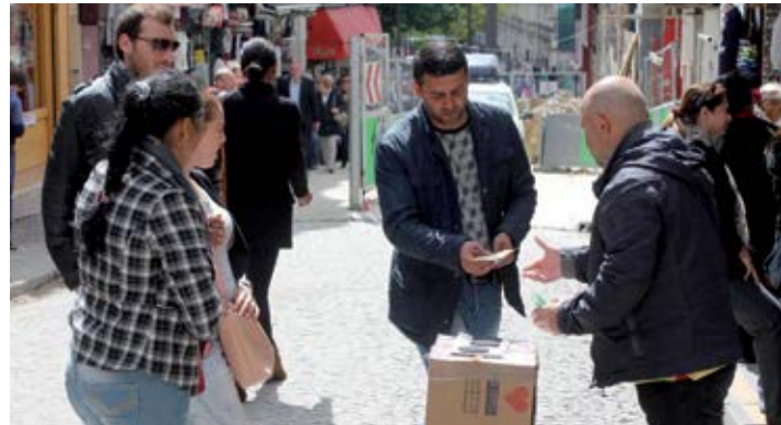
Des gobelets au bonneteau, du magicien à l'arnaque de rue